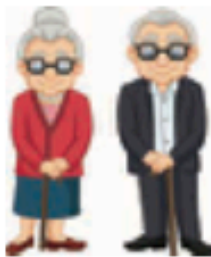
παπούδες / γιαγιάδες