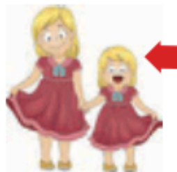
αδελφή / αδερφή