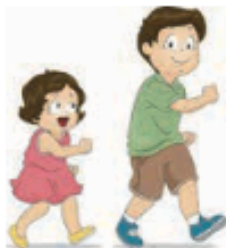
αδέλφια / αδέρφια