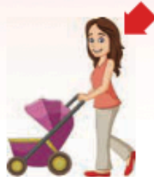
μητέρα / μαμά