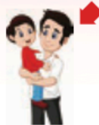
πατέρας / μπαμπάς