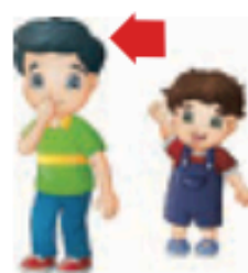
αδελφός / αδερφός