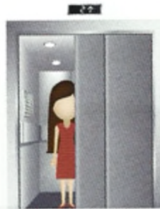
4 α _____