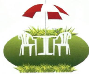
2 κ _____