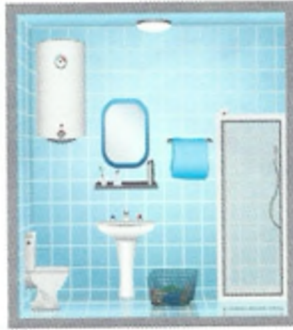
1 μ _____