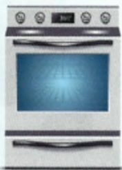
7 ηλεκτρική κουζίνα