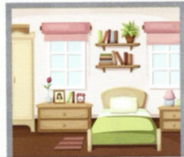
8 δ _____