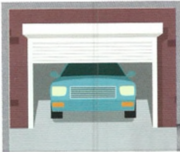
3 π _____