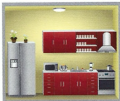
10 κ _____