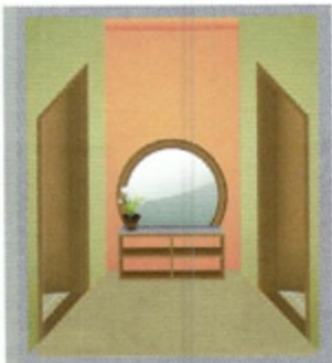
9 χ _____