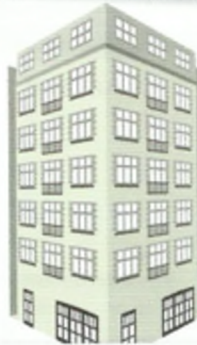
7 π _____