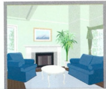
5 σ _____