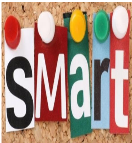
ο έξυπνος, -ή, ό