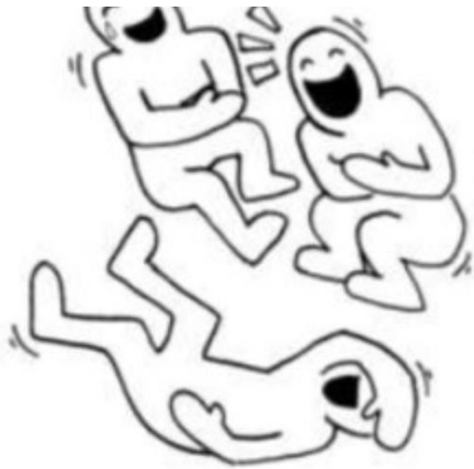
ο αστείος-η αστεία- το αστείο