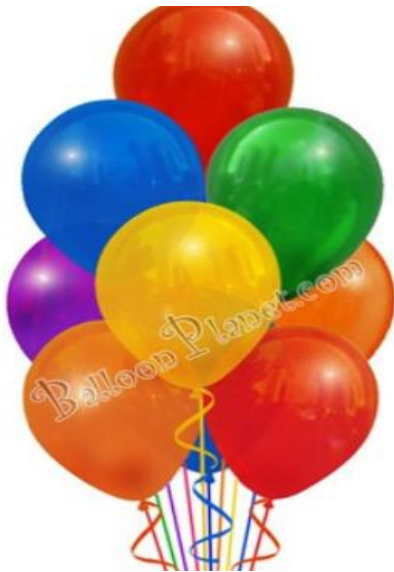
το μπαλόνι-τα μπαλόνια