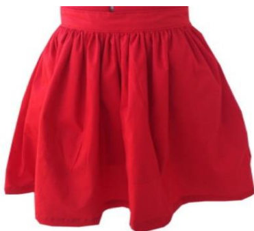
Η φούστα-Οι φούστες