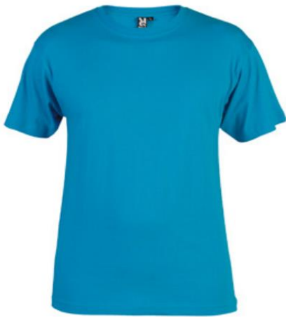
Η μπλούζα-Οι μπλούζες