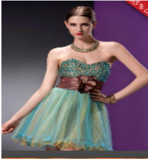
Το φόρεμα-Τα φορέματα