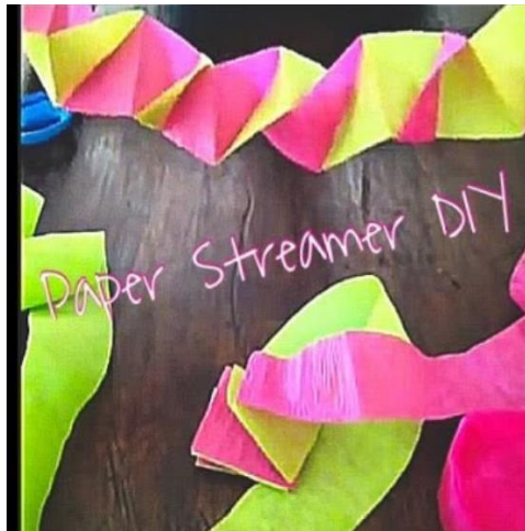
η γιρλάντα - οι γιρλάντες