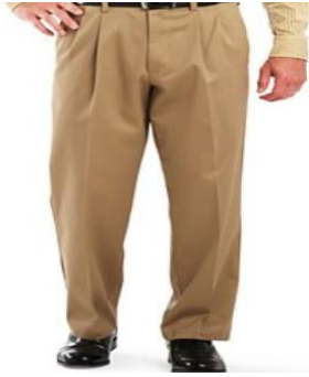
Το παντελόνι-Τα παντελόνια