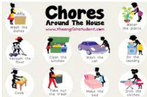
η δουλειά (στο σπίτι)-οι δουλειές