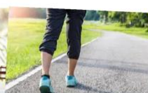
πηγαίνω... -στο σχολείο -στο πάρκο -στο σινεμά -στο σπίτι