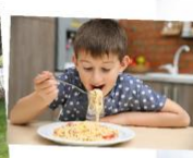
τρώω... -πρωινό -μεσημεριανό -βραδινό