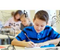
κάνω την εργασία για το σπίτι