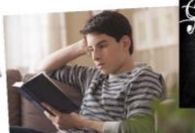
διαβάζω ένα βιβλίο