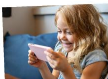
παίζω με το τηλέφωνό μου