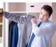
βάζω τα ρούχα μου