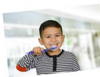
πλένω τα δόντια μου