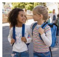
μιλάω με τους φίλους μου