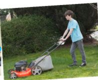
κάνω τις δουλειές του σπιτιού