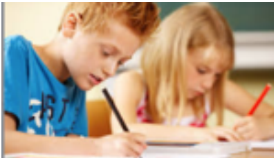
ο μαθητής , η μαθήτρια