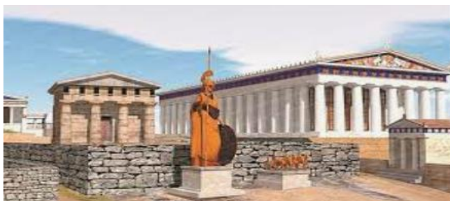
Η Ακρόπολη και η εποχή της

This Week: We will start working on the words and the grammar you learnt last week. You must be able to recognize the Greek letters Δδ, Ψψ as symbol and as sound. Say, read frequently used Greek words related to those letters. Read and write sentences with those words. In Reading we will focus on what characters are saying in a text. In grammar you have to know the endings of the nouns, to combine adjectives with nouns and to say if a word is a noun or an adjective