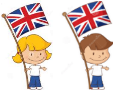
English (female / male)