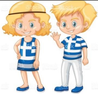
Greek (female / male)