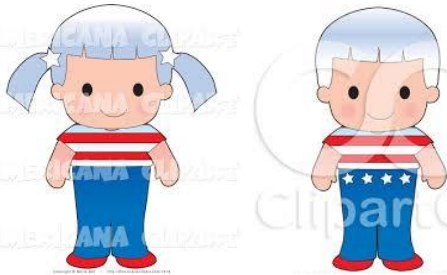
American (female / male)