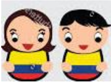
Colombian (female / male)