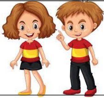
Spanish (female / male)