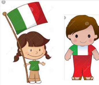
Italian (female / male)