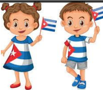
Cuban (female / male)