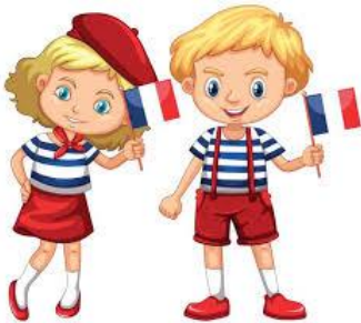
French (female / male)